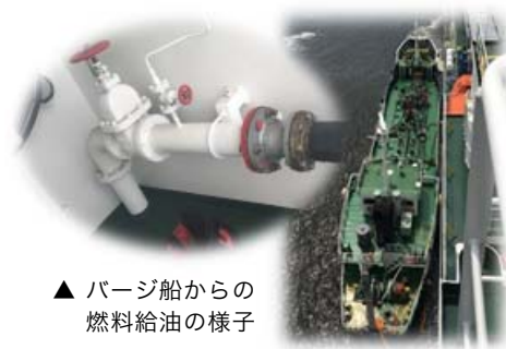
▲ バージ船からの燃料給油の様子

また、NTTビジネスアソシエ東日本では、下記の物品においてもコスト削減を実現してまいりました。これまでの実績とノウハウによりリバースオークションの活用方法を追及し、より多くのお客さまに貢献できるよう努めてまいります。