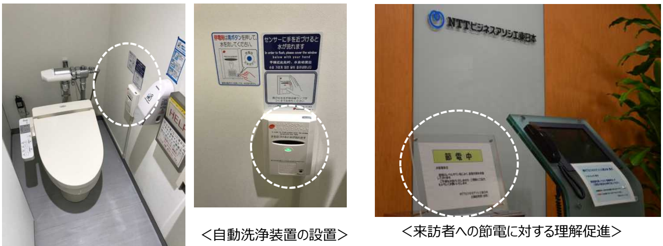
<自動洗浄装置の設置>