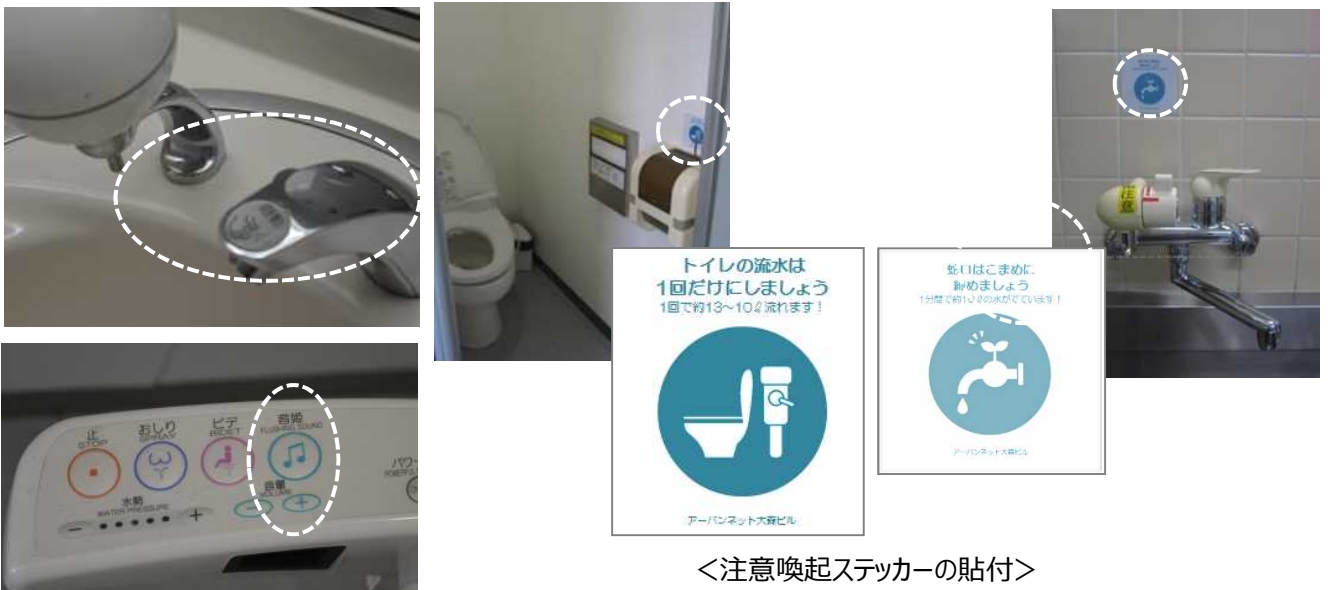
<注意喚起ステッカーの貼付>