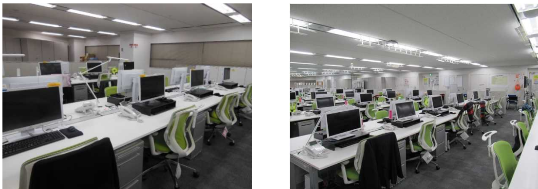
<クリーンオフィスの推進>