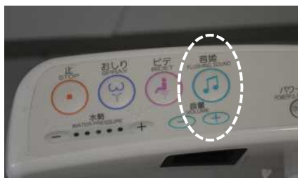
<洗面所の節水の推進（自動水栓・擬音装置）>