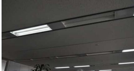
<不要な照明のOFF、事務室照明のLED化>