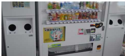
<省電力自販機の導入>