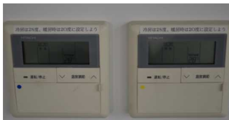
<空調機設定温度の遵守>