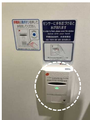
<自動洗浄装置の設置>