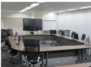
<ペーパーレス会議の推進>