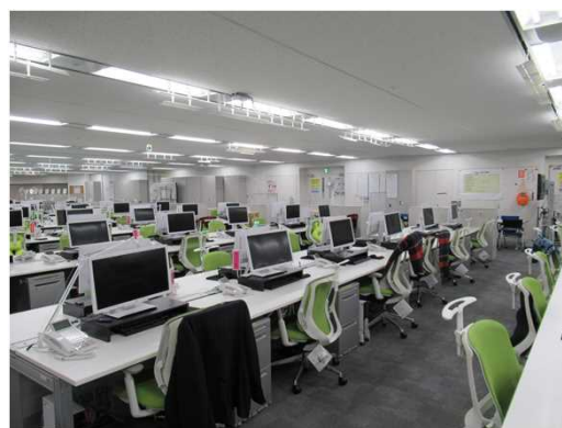
<クリーンオフィス・デスクの推進>