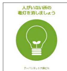
<注意喚起ステッカーの貼付>