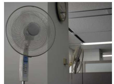
<扇風機の有効活用による空気循環>