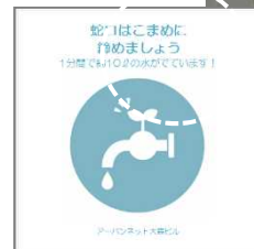
<注意喚起ステッカーの貼付>