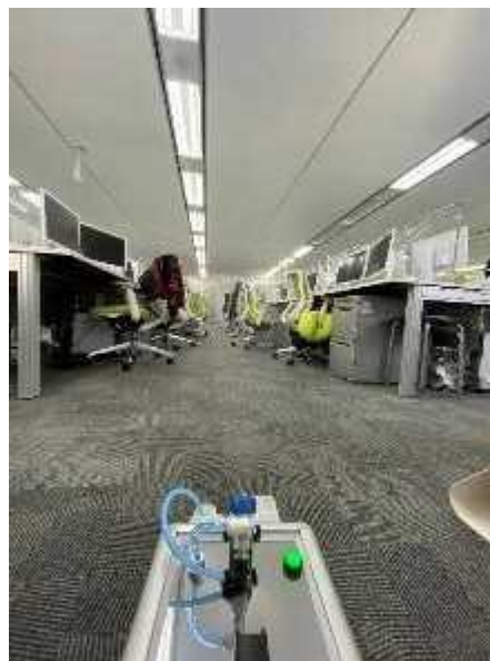
<各フロア全体の抗菌・抗ウイルスコーティングの実施>