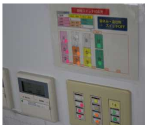
<照明スイッチの明確化>