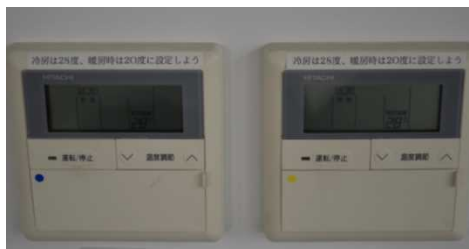
<空調機設定温度の遵守>