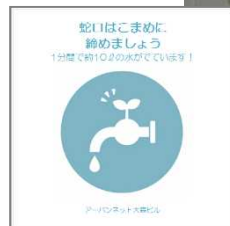
<注意喚起ステッカーの貼付>