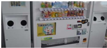
<省電力自販機の導入>