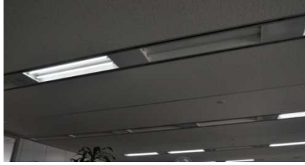
<不要な照明のOFF、事務室照明のLED化>